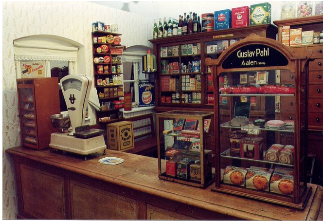
Ein Tante-Emma Laden wie in früheren Zeiten.